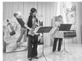
6/4 奈良ほろにがフェスティバル