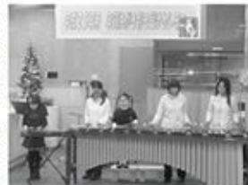
12/15 K.M.S.マリンバアンサンブル

6/4 奈良中央郵便局かもめ1号発売イベント Moana(ハワイアン音楽) 奈良ほろにがフェスティバル La Fenice(サクソ)