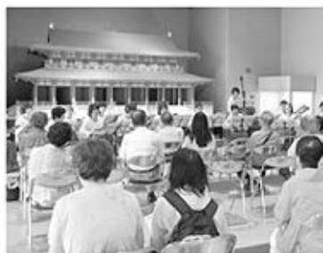
6/21 アンサンブルマレ