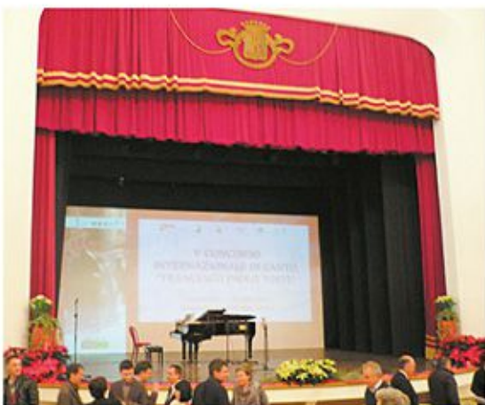
コンクール会場 (F.P.トステイ劇場)